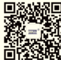
斯可络微信公众号

办公地址：深圳市宝安区新桥街道中心路 102 号时代中心大厦 4G 仓库地址：深圳市宝安区沙井镇岗头路 20 号中亚电子博览中心 联系方式：0755-33116256 传真：0755-33116257 E-mail: sale@scrgd.com 公司网址：www.scrgd.com