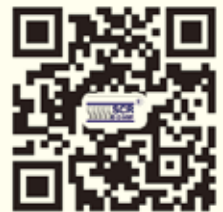
斯可络官方网站二维码

未经过斯可络压缩机（深圳）股份有限公司的事先书面授权，任何组织或个人不得使用文中的有关冠峰产品图片、图标、标识、注册商标、企业名称、网络域名等。